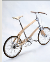
アトリエ・キノピオ