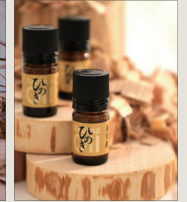
(株)島田小割製材所