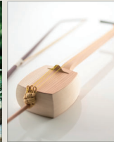
しゃみせん楽家 (株式会社楽家)